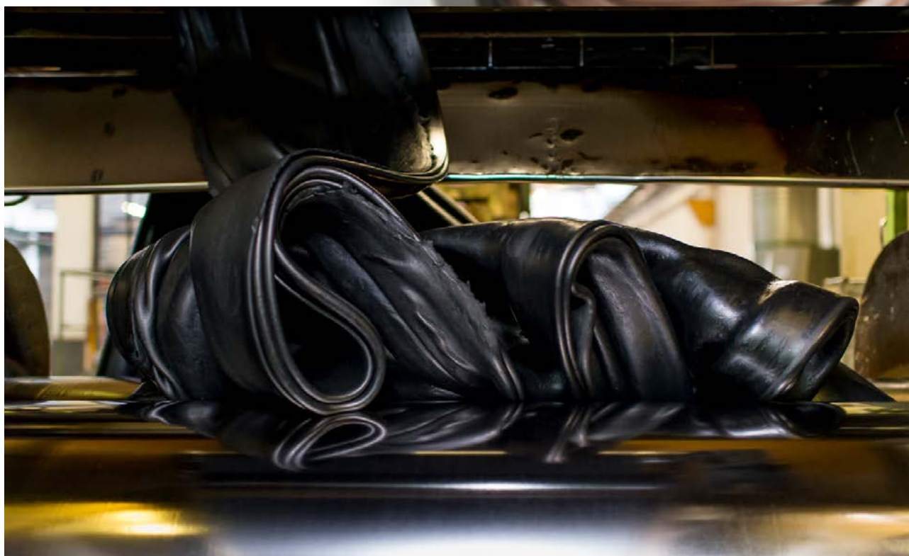
Mescola lavorata al mescolatore chiuso.