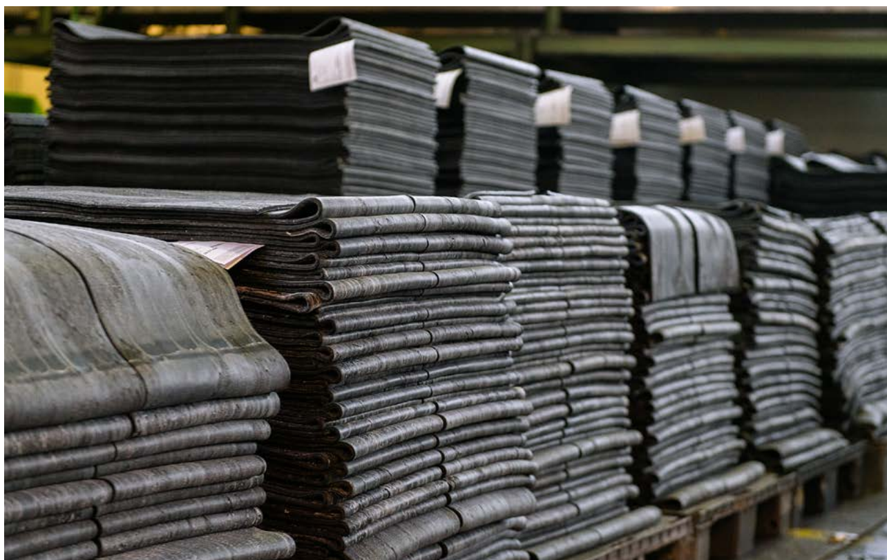
Mescole nere e bianche in festoni (foto sopra e foto sotto).