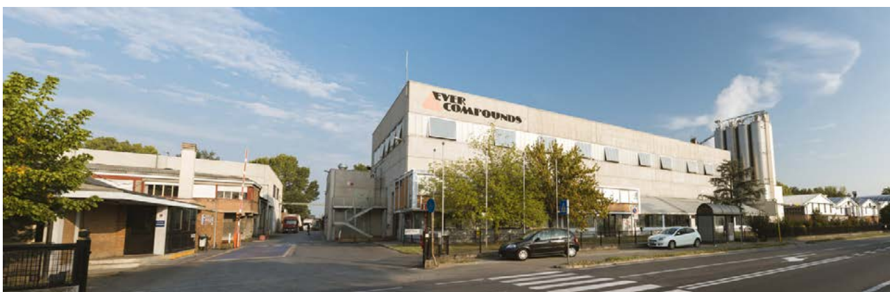
La sede di Evercompounds a Fusignano, in provincia di Ravenna.

Nata nel 2001, Evercompounds festeggia quest'anno i suoi primi 20 anni di vita all'insegna di sviluppo e innovazione. Un percorso che ha visto la progressiva adozione di nuovi macchinari e di un approccio sostenibile, orientato alla riduzione al minimo degli scarti. A tutto questo si aggiunge la spinta all'internazionalizzazione, che all'apertura nel 2015 di una sede negli Usa farà seguire il prossimo anno il ritorno alle più importanti fiere di settore