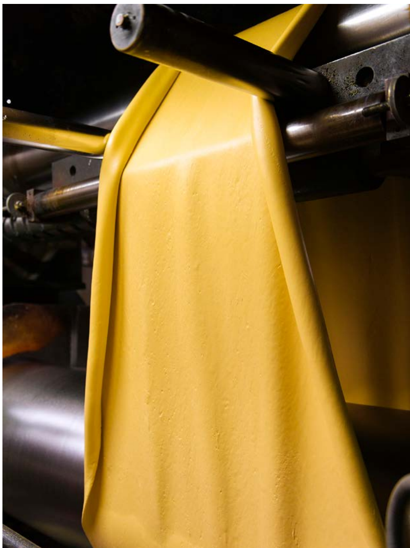
Mescola lavorata al mescolatore aperto.

Evercompounds prevede quindi una presenza mirata alle fiere dei prossimi anni, che offrano concrete opportunità di acquisizione di nuovi clienti e nuovi mercati o, comunque, interessanti seminari tecnici a cui partecipare. ◆