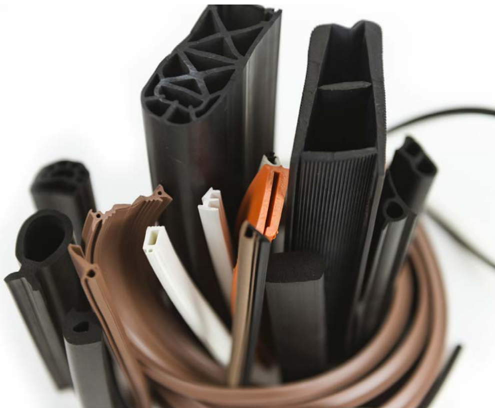
Profili estrusi realizzati con mescole Evercompounds.

Nel corso degli anni seguenti i volumi di produzione aumentarono considerevolmente, anche per supplire alla difficoltà di CM Manzoni nell'esaudire le richieste del mercato, a causa della ristrettezza del suo sito produttivo: nel 2015/2016 fu così deciso di potenziare ulteriormente la produttività di Evercompounds, con il trasferimento di una linea della CM Manzoni. Oggi, il polo produttivo è così suddiviso: 2 linee nello stabilimento di CM Manzoni, una dedicata